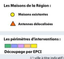
Périmètres d'interventions des Maisons de la région Hauts-de-France janvier 2026