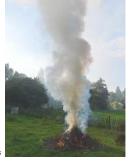
Brûlage effectué par des particuliers

Dans la région Hauts-de-France, la pollution de l'air par les particules fines (PM2.5) est à l'origine de 6 500 décès prématurés par an (source : Santé Publique France, 2016).