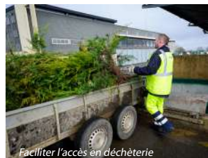
Faciliter l'accès en déchèterie

302 déchèteries réparties sur tout le territoire régional 98 % de la population de la région a accès à une déchèterie