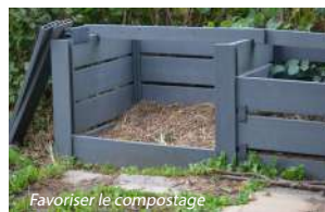
Favoriser le compostage